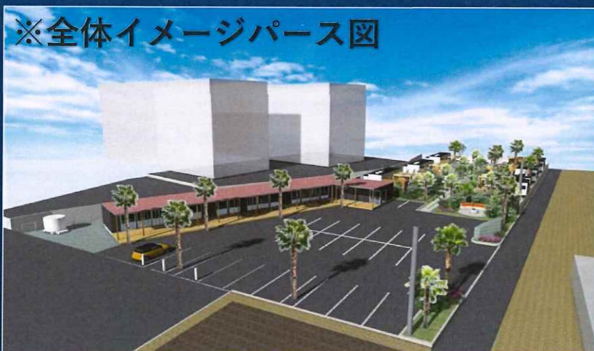
※全体イメージパース図